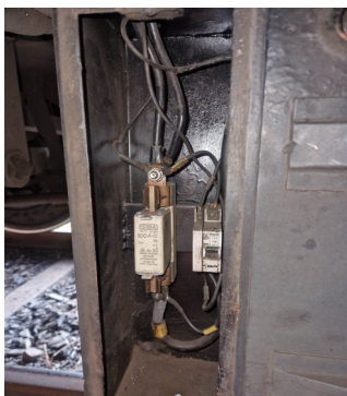
Batteriekasten mit 100A Sicherung