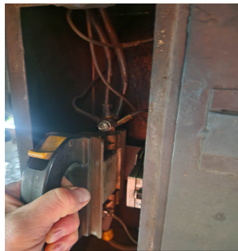
Sicherungsgriff (in einem der beiden Kästen)