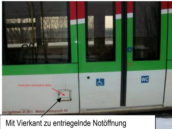
Mit Vierkant zu entriegelnde Notöffnung