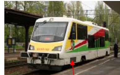
Kühleranlage mit hydrostatischem Antrieb und Vorratsbehälter