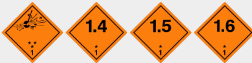
Klasse 1: Explosionsgefährliche Stoffe

Folgende Placards (Großzettel) können nach den ADR-Vorschriften angebracht sein (zu detaillierteren Vorgehenshinweisen zu den einzelnen Klassen siehe CBRN-Einsätze / ABC-Einsätze / GSG-Einsätze ):