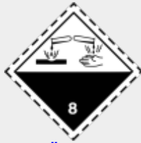
Klasse 8: Ätzende Stoffe