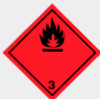
Klasse 3: Entzündbare flüssige Stoffe