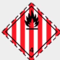
Klasse 4.1: Entzündbare feste Stoffe, selbstzersetzliche Stoffe und desensibilisierte explosive feste Stoffe