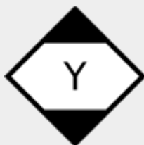
gefährliche Güter in begrenzten Mengen - Luftfracht