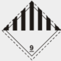
Klasse 9: Verschiedene gefährliche Stoffe und Gegenstände