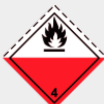
Klasse 4.2 Selbstentzündliche Stoffe