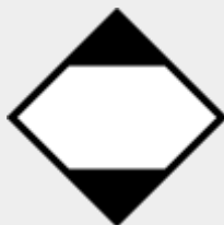
gefährliche Güter in begrenzten Mengen