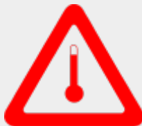
Stoffe, die in erwärmtem Zustand befördert werden