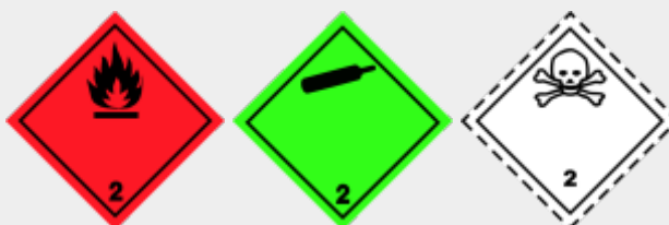
Klasse 2: gasförmige Stoffe