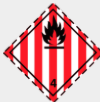
Klasse 4.1: Entzündbare feste Stoffe, selbstzersetzliche Stoffe und desensibilisierte explosive feste Stoffe