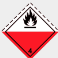
Klasse 4.2 Selbstentzündliche Stoffe