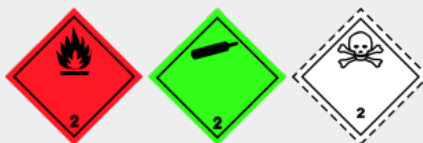
Klasse 2: gasförmige Stoffe