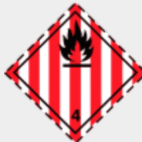
Klasse 4.1: Entzündbare feste Stoffe, selbstzersetzliche Stoffe und desensibilisierte explosive feste Stoffe